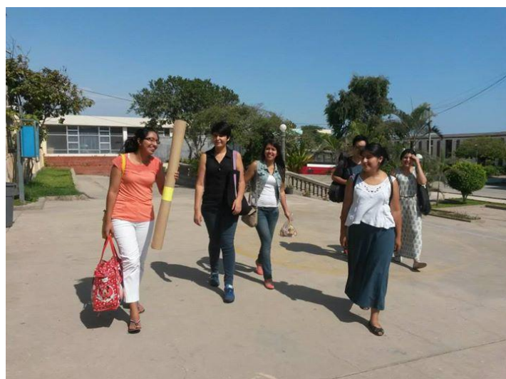
El equipo de lectura divertida compartiendo y conversando antes de salir del Puericultorio.