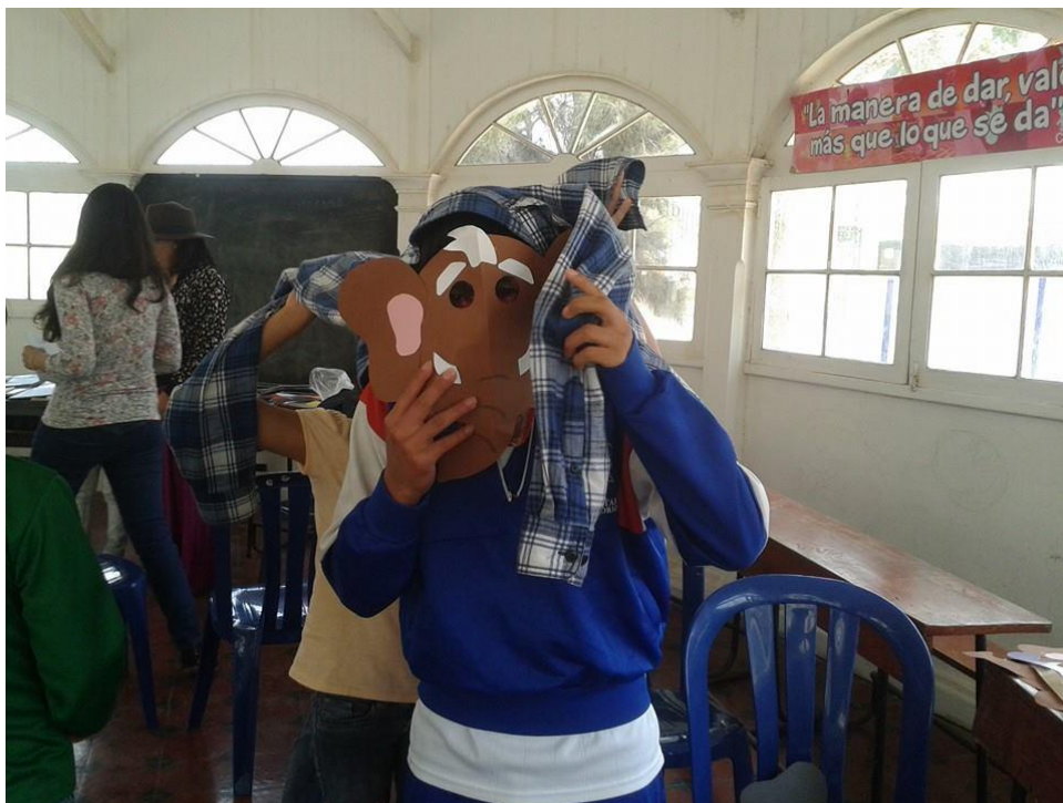
Los niños emplearon recursos artísticos para responder a las preguntas de la lectura. Se utilizó el teatro como una forma de expresión.

Asimismo, en las últimas sesiones se trabajó la técnica del Binomio Fantástico 6 recurso narrativo desarrollado por el pedagogo italiano Gianni Rodari, en el que se utiliza dos palabras al azar para crear historias. Con el fin de integrar el juego con esta herramienta literaria los niños(as) tuvieron a su disposición títeres pequeños para crear sus historias que luego expusieron por equipos como una obra teatral dentro del salón. La exposición de cada una de las historias se realizó de manera cómica y fueron de deleite para sus compañeros que los animaban a participar aplaudiéndolos. Aunque habían momentos de desorden, se aprovechaba para hablar sobre el respeto y el cariño que se debían de tener sobre todo a ellos mismos y a los demás: el tratamiento de los valores fue un eje fundamental en Lectura Divertida.