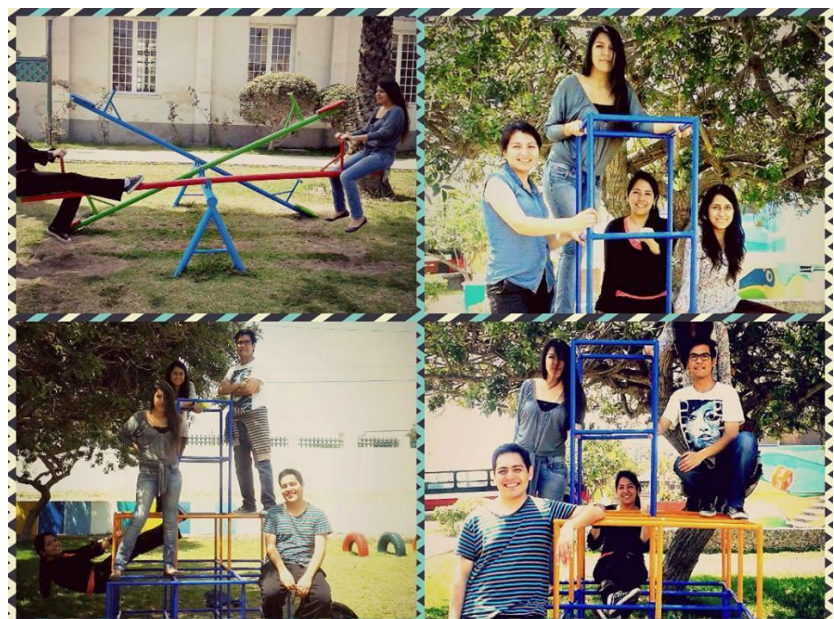
Los voluntarios, talleristas y gestoras disfrutando de algunos espacios del Puericultorio, después de los talleres de lectura divertida