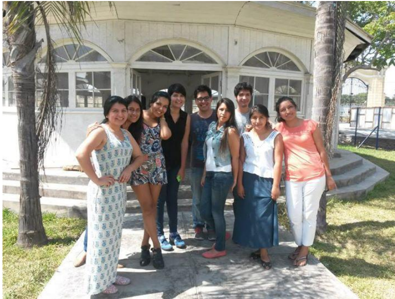
Las gestoras y voluntarios en la Pérgola (lugar donde se desarrollaron los talleres).

Líneas abajo se esquematiza los colaboradores del proyecto de manera más precisa en dos cuadros: uno de los participantes internos (integrantes PUCP involucrados en la dirección del proyecto) y otro con los participantes externos, aquellos conocidos como contrapartes, pues no forman parte de la comunidad PUCP, ni del equipo de gestoras, pero permitieron el desarrollo de la iniciativa.