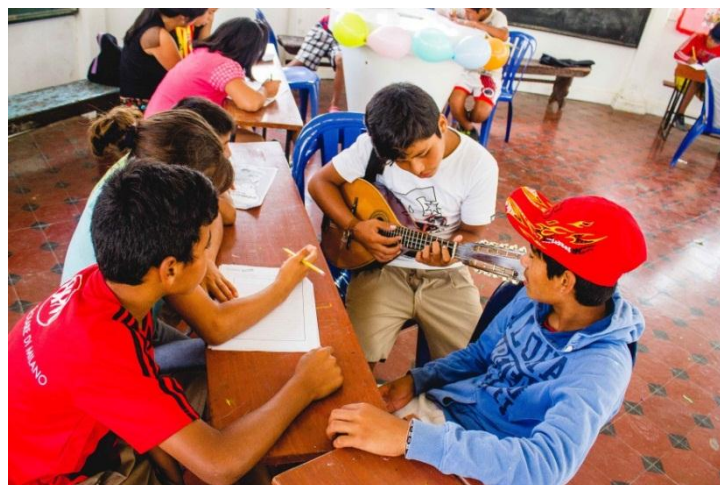
Niños y niñas disfrutaban de diversas actividades (cantan y dibujan)

Esta nueva aventura busca mejorar el nivel de comprensión lectora de las niñas y niños a partir de actividades artísticas, lúdicas y creativas, fortalecer la autoestima (autoconocimiento y confianza en sí mismos) y la práctica de valores en los niños y niñas; además, de promover el desarrollo de habilidades interpersonales y sociales (la escucha, la participación, la asertividad y el trabajo en equipo) de niñas y niños integrantes del proyecto. Todo ello con el fin de fomentar el aprendizaje de la comprensión lectora en los niños (as) participantes del proyecto a partir de un enfoque integral, en donde se cree un entorno de aprendizaje positivo, que potencie el autoestima y la motivación, y que favorece la cooperación grupal y social, de modo que facilite el desarrollo académico, emocional y social de los niños.