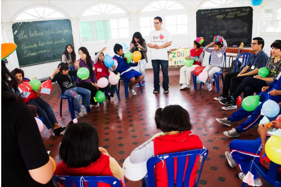
En el taller- evento La Lectura en mi vida , los niños y niñas escribieron en los globos, cantaron, compartieron vivencias en relación a la lectura y leyeron.