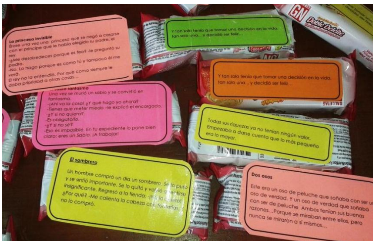
Algunas de las mini historias entregadas a los niños(as) junto con sus refrigerios (galletas, queque, yogurt, frugos, etc.)