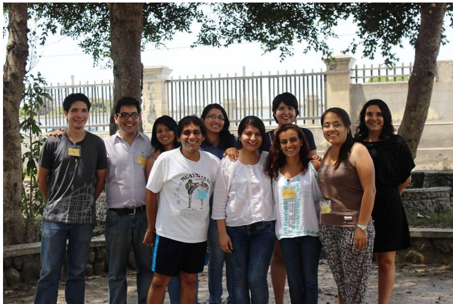
El equipo de Lectura Divertida (faltan algunos miembros), acompañados de nuestras asesoras de la Dirección Académica de Responsabilidad Social.