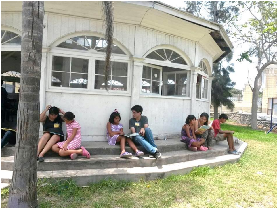
Los niños(as) disfrutaron de su momento de lectura independiente en compañía de los voluntarios, en esta ocasión en las afueras de la pérgola.